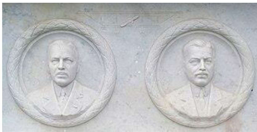
Monument aux frères Caudron au Crotoy (Somme)

Il s'est tué le 12 décembre 1915 à Bron, lors du vol d'essai d'un Caudron R4 fraîchement assemblé.